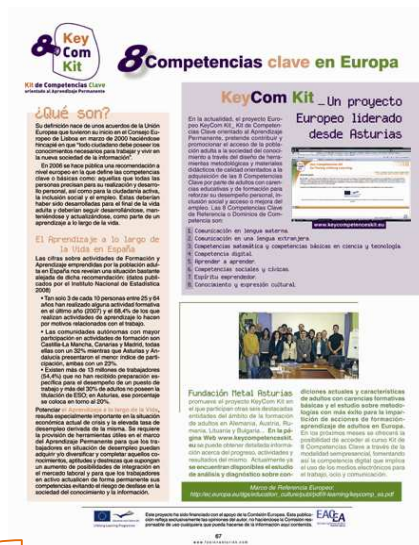
Articolul Keycom in FUSION

„Acest proiect european favorizează crearea unor unelte metodologice și materiale didactice vizând achiziția celor 8 competențe cheie de către adulții cu lacune în pregătire și educație. Fundación Metal Asturias și alte 6 entități din sfera educației adulților din Germania, Austria, România, Lituania și Bulgaria pun la dispoziție acest nou pachet de resurse didactice.”